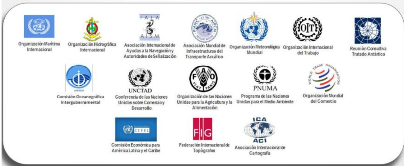
Figura 3. Organismos internacionales relacionados con el sector marítimo.