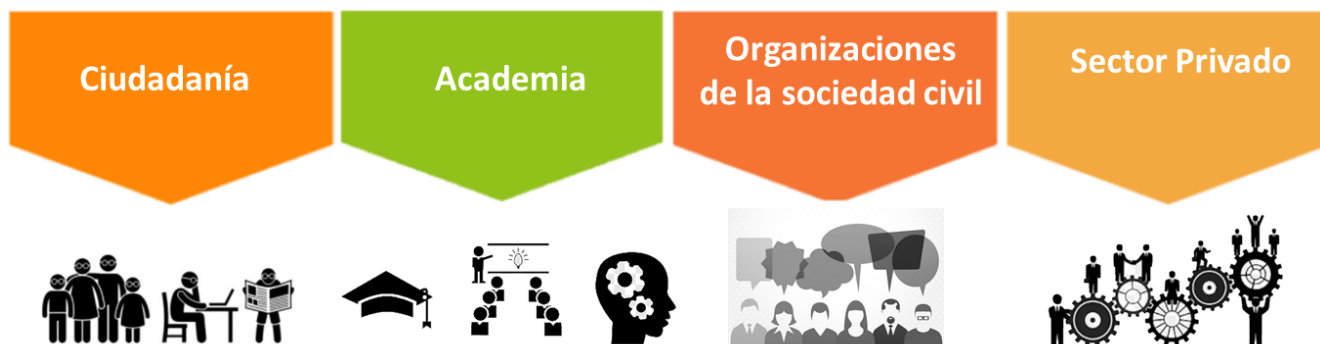
Figura 5. Usuarios de la información estadística.

De igual manera, en el ámbito del SEN la Dimar tiene usuarios pertenecientes a las categorías descritas en el Figura 5, tal como se aprecia en la relación con las partes interesadas del ecosistema de datos dispuesto en el Anexo B.