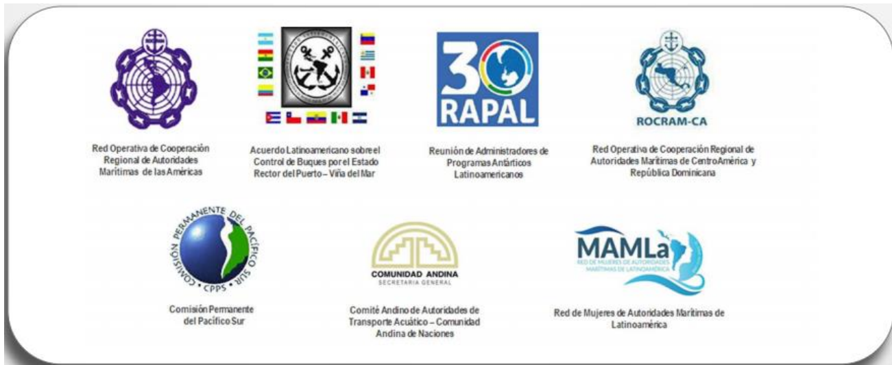
Figura 4. Organismos regionales relacionados con el sector marítimo.

En términos generales el relacionamiento con estos organismos internacionales, en cuanto a información se refiere, se origina cuando emiten conceptos estandarizados, reglamentaciones aplicables a las actividades marítimas y a su vez, solicitan reportes sobre el estado del sector, así como el cumplimiento de las regulaciones emitidas; por lo tanto, exhiben un doble rol como productores y usuarios de información estadística.