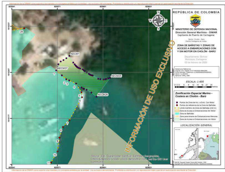
Imagen No. 2. Zona de Bañistas, Zona de Acceso a Embarcaciones con Motor y Sin Motor en la Ciénaga de Cholón, Barú – Cartagena D. T. y C.

Artículo 4.2.5.4.4.8. Zona de acceso a naves sin motor: contempla un área de trescientos cincuenta y nueve metros cuadrados (359 mts 2 ), contigua hacia el Norte de la Zona de Bañistas, hasta un área de protección de cinco metros (5 m) de distancia de las raíces adventicias del manglar presente en la zona, por lo que presenta un ancho variable que va desde los diez metros (10 m) hasta los diecinueve metros (19 m). Se ubica en terrenos con características técnicas de Agua Marítima el área de playa que permite el embarque y desembarque de personas