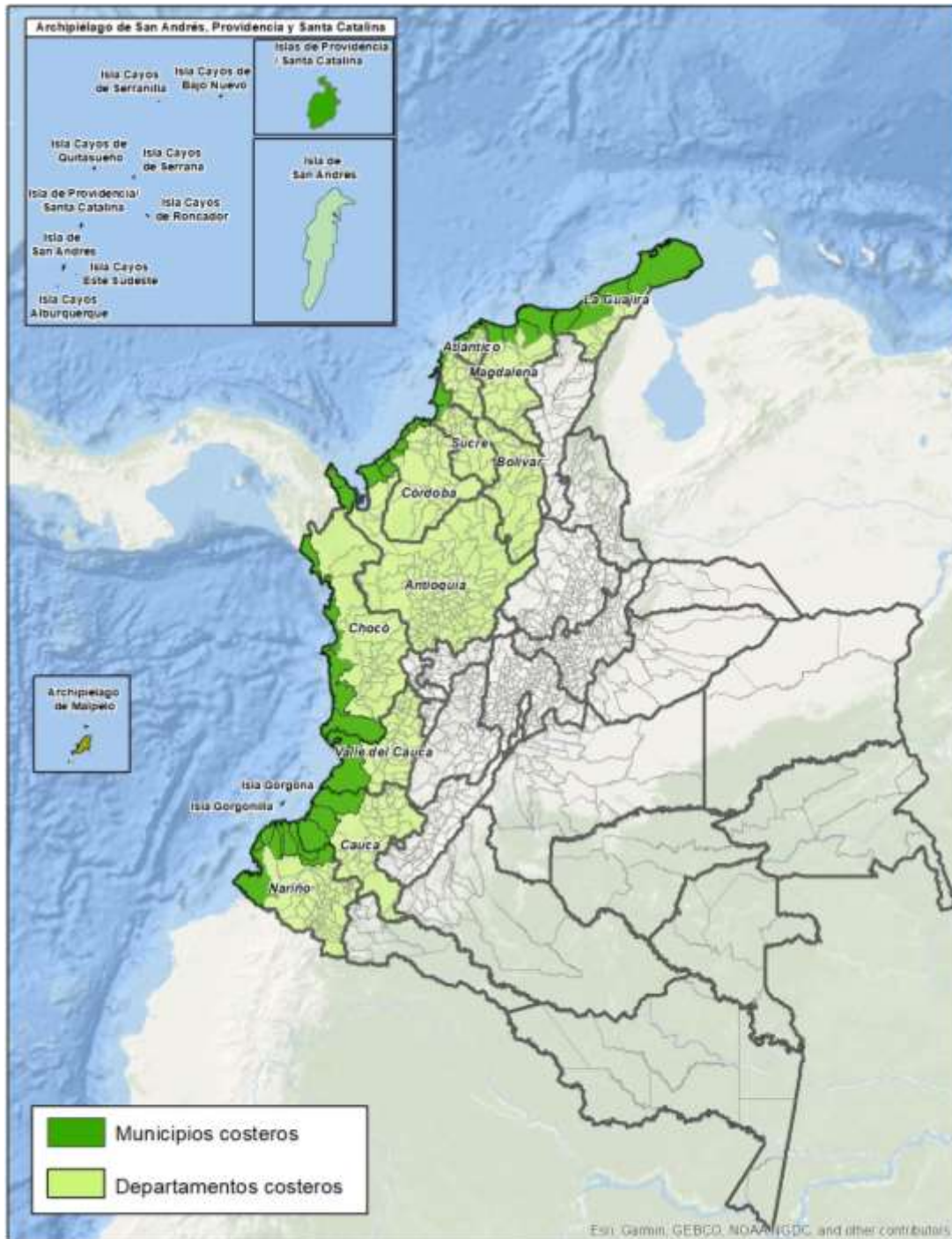
Ilustración 1. Archipiélagos, departamentos y municipios costeros de la República de Colombia (a)