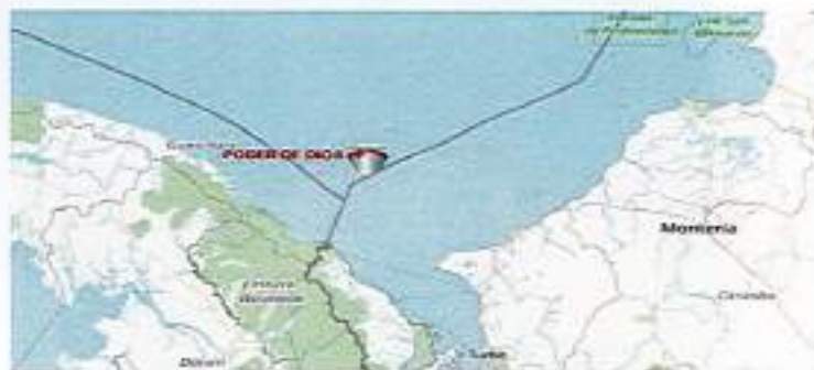
En la presente imagen se puede observar que la motonave PODER DE DIOS se encuentra en los límites próximo a Panamá