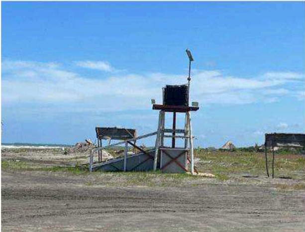
Imagen 3. Vista de estructura con rampa usada como ducha para los bañistas.

Copia en papel auténtica de documento electrónico. La validez de este documento se verifica mediante el código QR que aparece en la parte superior del documento.