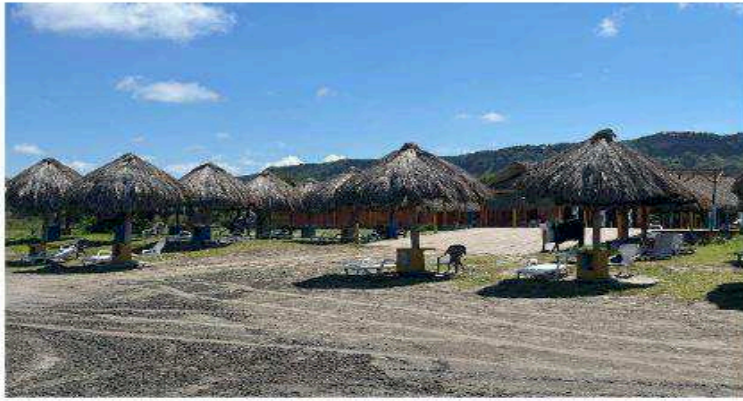
Imagen 1. Vista general de las zonas de quioscos. Se observa material de concreto.

Quiosco Bar: se identifica un quiosco principal de mayores dimensiones ( imagen 2 ) el cual posee piso de concreto, columnas de madera y techo de paja, además de una barra en bloque. Este ocupa un área de aproximadamente noventa y tres coma tres metros cuadrados (93,3 m 2 ).