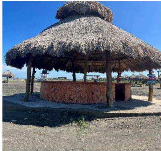
Imagen 2. Vista general de quisco en concreto ubicado en las playas del Hotel Arena Beach. Se evidencia suelo en concreto.

Quiosco Bar: se identifica un quiosco principal de mayores dimensiones ( imagen 2 ) el cual posee piso de concreto, columnas de madera y techo de paja, además de una barra en bloque. Este ocupa un área de aproximadamente noventa y tres coma tres metros cuadrados (93,3 m 2 ).